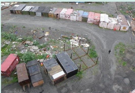
Вид из окна